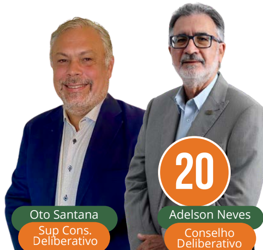
Oto Santana Sup Cons. Deliberativo